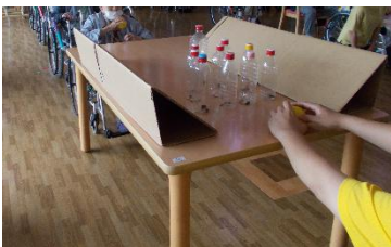
ボーリング 皆さん慎重に、一本でも多く倒す為狙いを定めていらっしゃいました。