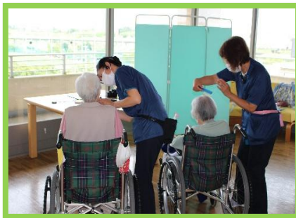
女性陣は髪の毛のセットやお化粧で大忙し