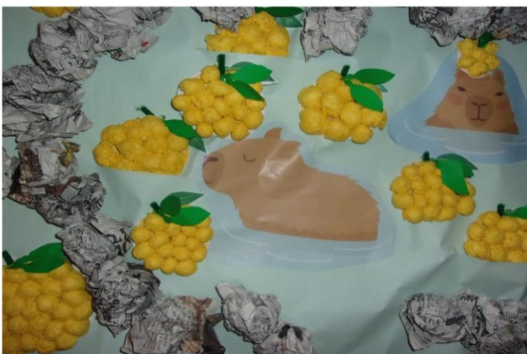
テーマ:ゆず湯でほっこり あーいい湯だな あははん byカピバラ