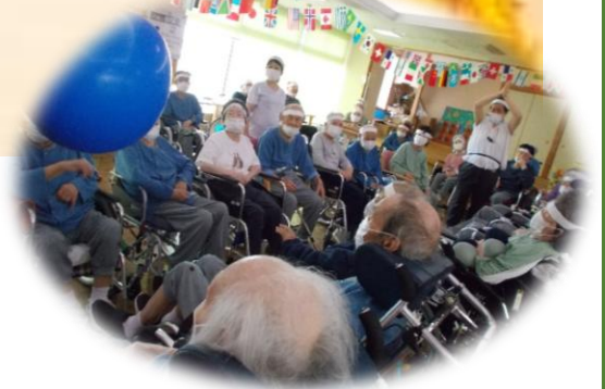
大風船送り。利用者様も職員も夢中です。

10/12(日)第19回グリーンビレッジ朝霞台大運動会が開催されました。日ごろのリハビリの成果を十分に発揮し利用者様一同励まし合い助け合いながら最後まで楽しんで参加して頂きました。今年度は職員競技も復活！フロア対抗で競い利用者様の応援が更に熱くなりました。