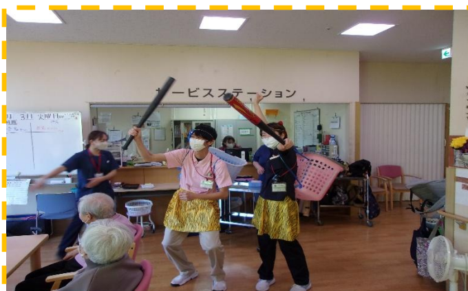
リハビリスタッフの飛び入り参加！優しい鬼たちです♥