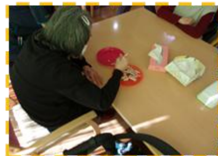
箸使いがお見事です☺