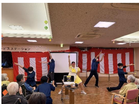
練習バッチリ、本格オタ芸 (腰に来たー by 出演職員)

年末は冬の花火が恒例でしたが、今年は指向を変えて、職員が身体を使ったパフォーマンスや一年の振り返り動画を披露させて頂きました。職員有志による本格的な実演【オタ芸】を鑑賞したり、シルエットで都道府県クイズやパンやコーラの早食い競争の優勝者を当てていただいたりと、笑いが続く中、最後は一年の振り返り動画上映です。10 分程度の上映でしたが、日々のレクリエーションや運動会など一年間にあった映像が流れ、利用者の皆様も興味深くご覧になられていました。今年一年も楽しんで頂けるよう頑張ります。