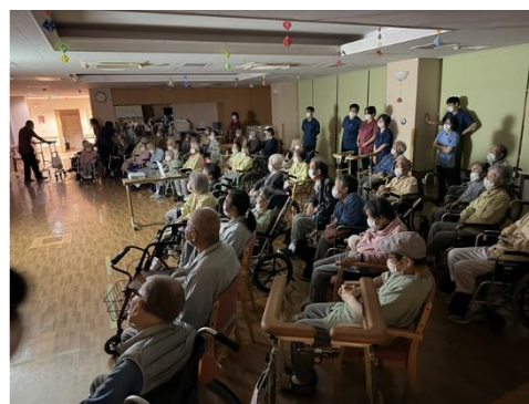
振り返り動画にくぎ付けの皆様