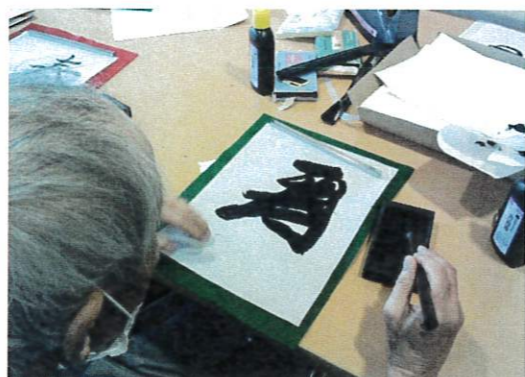
「寿」と書いてくれていますコツは 「太く」だそうです(笑)