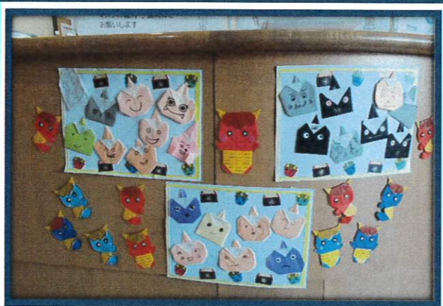
ご利用者の皆様が、一つひとつ 丁寧に作成して下さいました。

今年も、この様な作品作りや、おやつレク、花火観賞など、フロア独自の行事でご利用者様に楽しんで頂ける様、取り組んでいきます。今年も宜しくお願いします。