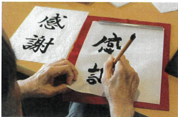
中学校から習っており達筆で上手です。 先生と呼ぶと喜んでくれました

施設で2月に書道展が開催されるにあたり、2階フロアのご利用者様にも書道を行って頂きました。硯に墨汁を入れてもらい見本を見ながら書いて頂きました。同じ見本ですがそれぞれご利用者様ごとに個性が出て良い作品になりました。1階のエレベーター前に掲示する予定なので施設に來所された際は是非ご覧ください。ご利用者様が楽しめるような活動を今後も提供していきたいと思ひます。