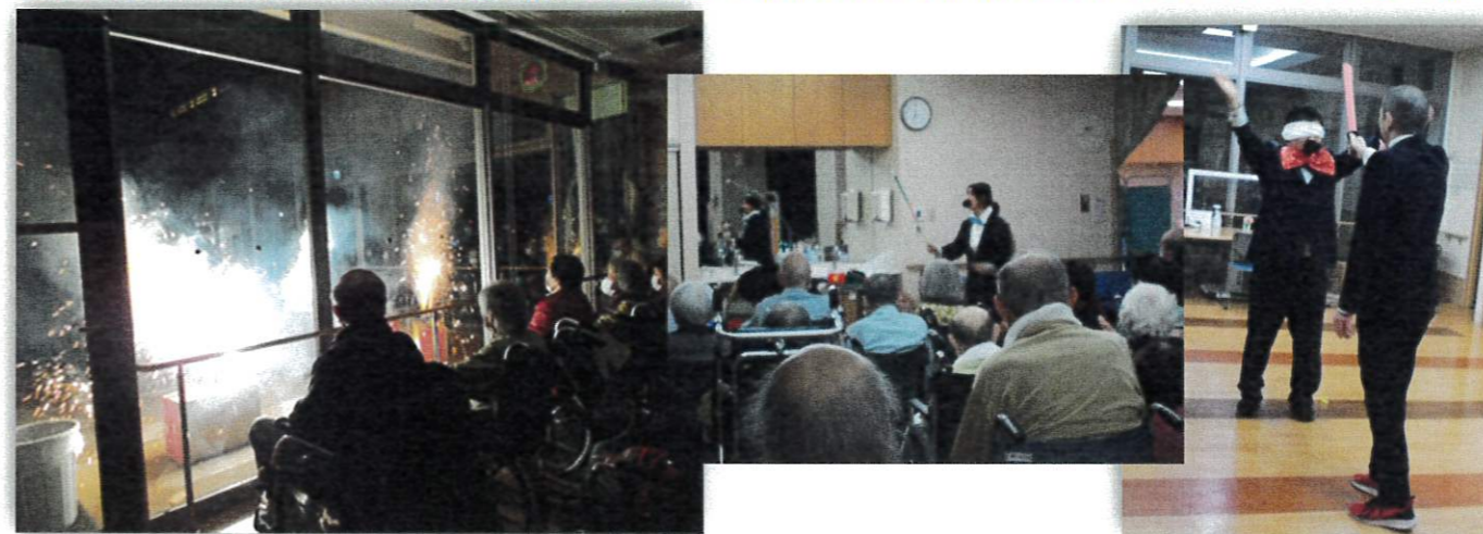
…冬の花火は空気が澄んでとっても綺麗ね…

夕食後1階に降りていただき、まずは職員による余興を披露。今年は「ひげダンス」を踊り、そこからの真剣白刃取りや輪投げなど行い、拍手喝采を戴いた次第です。その後は、冬の花火です。1階/八室からの窓越しですが迫力ある輝きを鑑賞し、点火するたび歓声が上がり、皆さん楽しんでいただいていた様子でした。4階に戻った後も「楽しかった」「感動した」「綺麗だった」とのお言葉が続いていました。尚、2月に書道展が開催されるにあたり、4階の作品も展示しています。今年《四季の歌》の歌詞を利用者様に書いて頂き、挿絵も利用者様の塗り絵で彩りました。(表紙)是非ご鑑賞ください。