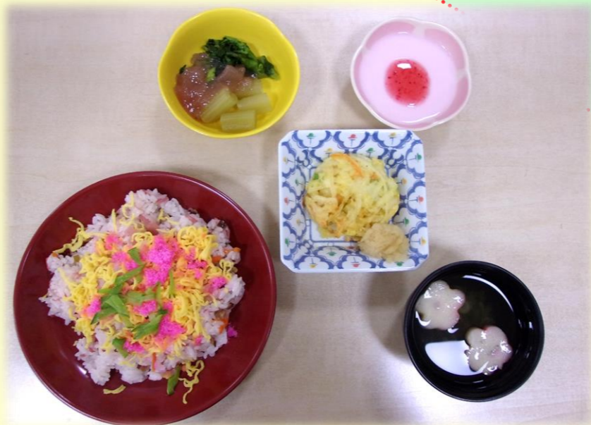
《 嚥下調整食 》