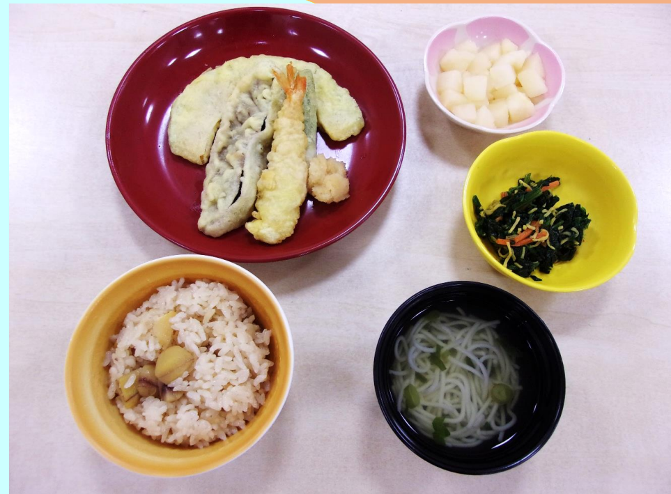
《 嚥下調整食 》