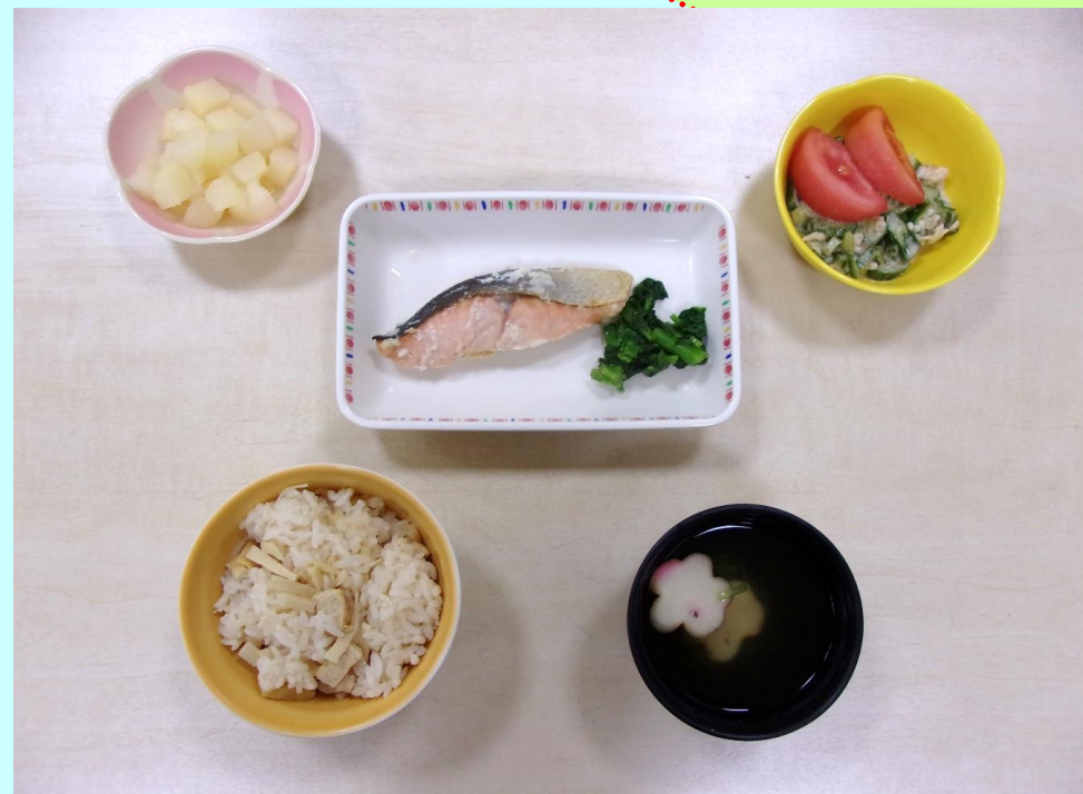
《 嚥下調整食 》