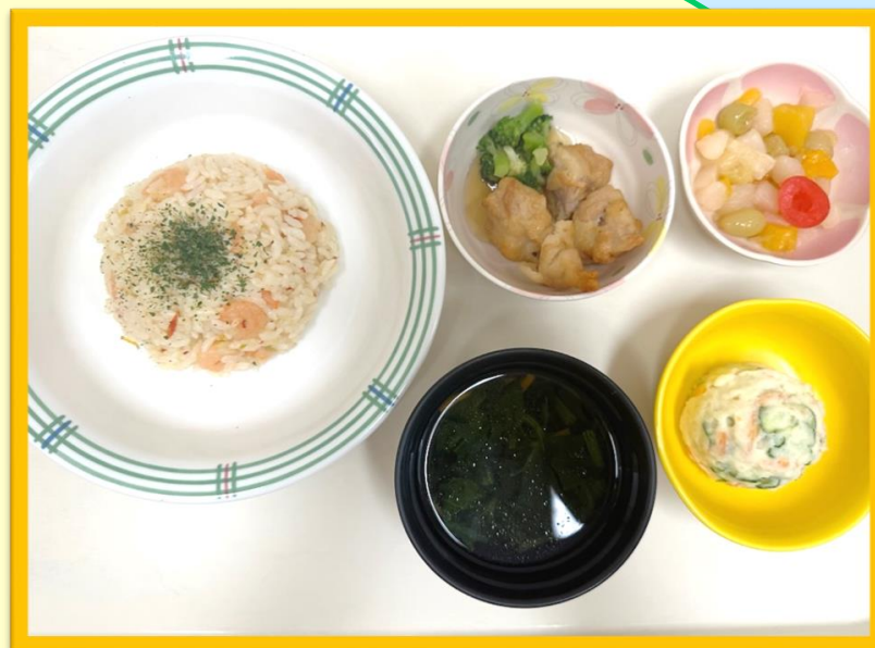
《 嚥下調整食 》