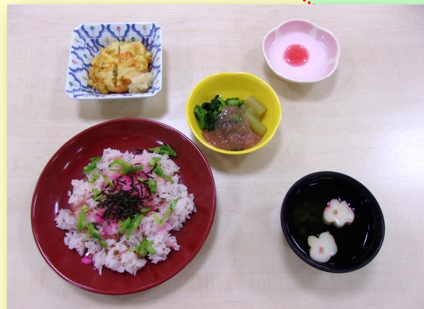
《 嚥下調整食 》