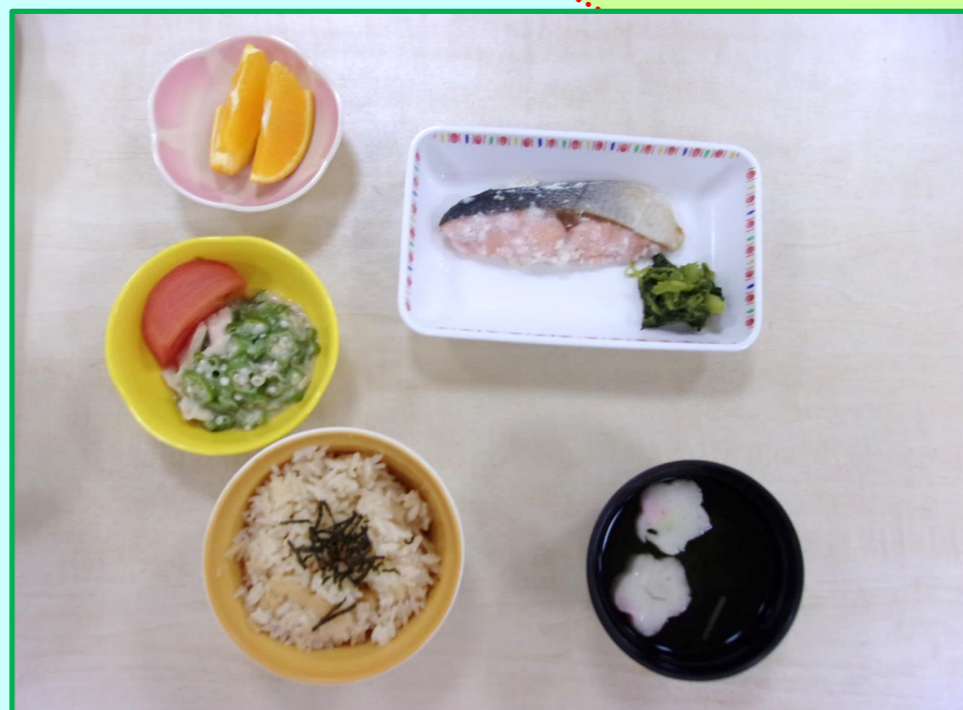
《 嚥下調整食 》