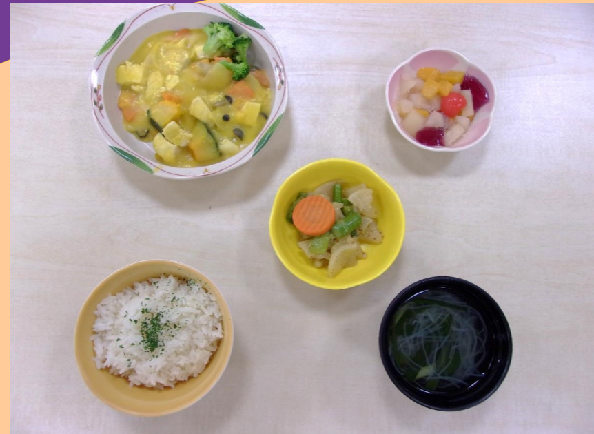
《 嚥下調整食 》