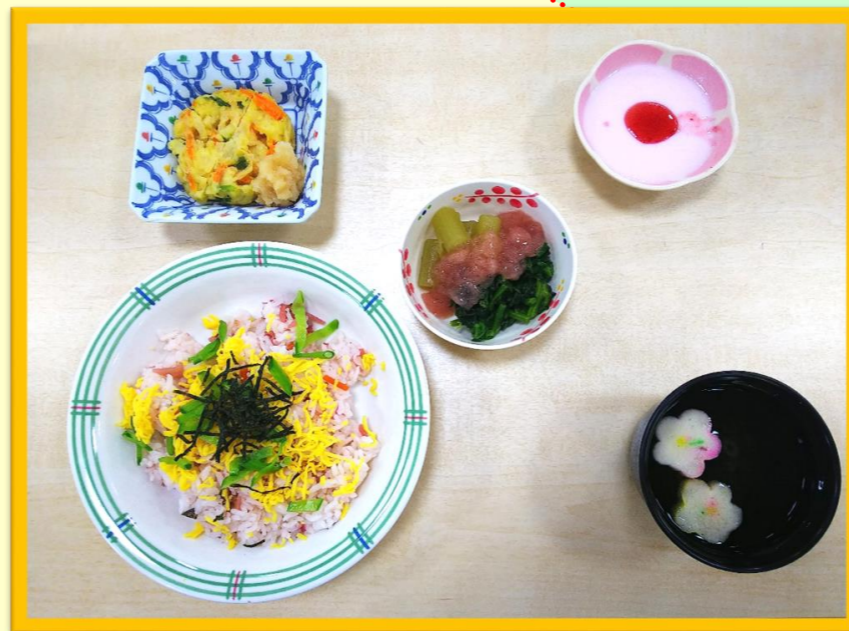
《 嚥下調整食 》