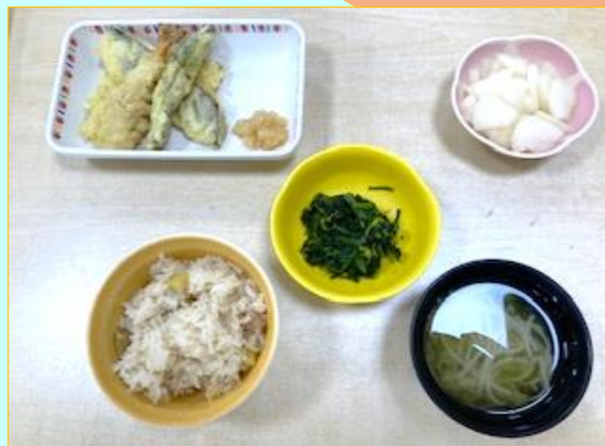
《 嚥下調整食 》